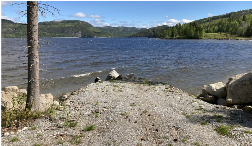
Figur 3, Vy över tänkt plats för vågbrytare, pir och sjösättningsramp.