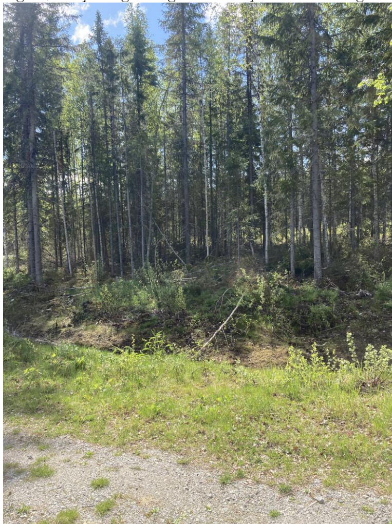
Figur 2, Vy över tänkt plats för ramp och dass.