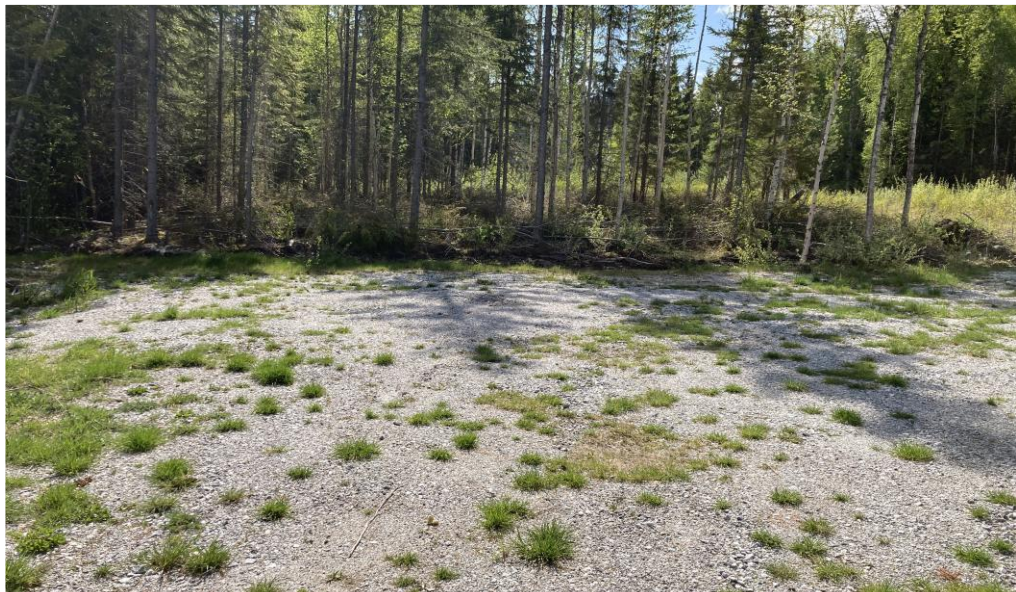
Figur 4, Vy över befintlig parkering/vändplats.